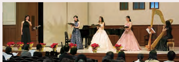
クリスマス・ミニコンサート