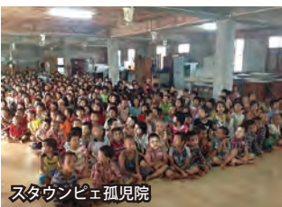
スタウンピエ孤児院

最終日の一六日もヤンゴンを訪れ、カレーワ女子孤児院とスタウンピエ孤児院を視察しました。孤児院では、子どもたちとキャッチボールをして遊びました。また、お互いに歌やダンスを披露し、ミャンマーの伝統的な踊りを子どもたちに教えてもらいながら踊りました。孤児とは思えないほど明るく気さくな子どもたちと遊び、自分は恵まれた環境で過ごしているけれど、その環境を活用できないことに少し未熟さを感じました。