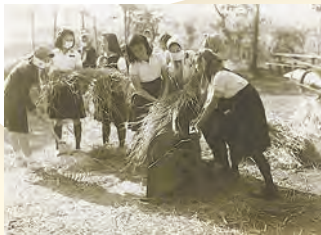
高等女学科: 小平市花小金井の学校農場 真夏の除草では、讚美歌の「ひたいを落つ る玉のあせ 化して垂穂の実となりぬ」を 実感