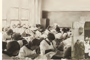
5年生による傷病兵の 白衣製作