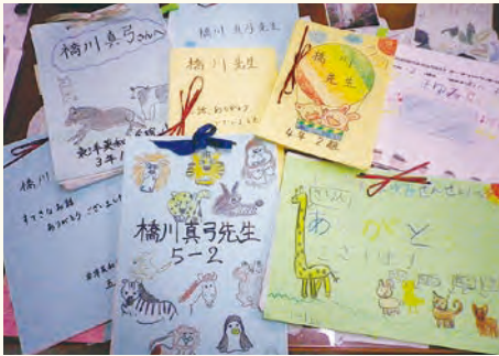
橋川さんへの感謝のお手紙