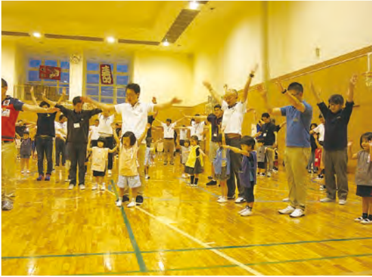
父子でラジオ体操「1、2、3、4…」

ダンス、ラジオ体操に続いて最初の競技は四歳児の玉入れです。お父さまの声援の中、頭上のカゴ目がけて紅白の玉を投げける子どもたちの表情は真剣そのものでした。次は、三歳父子の「出発進行」。父子で段ボールの電車に乗り込み、橋を渡り、踏切を通り過ぎ、くねくね道を走って終点まで進みます。ゆっくりと和やかな電車の旅でした。