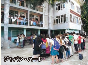
ジャパンのハート

の荷台に座席が付いているだけでドアはなく、坂道では落ちてしまうのではないかと、うくらいスリルがありました。日本では考えられないような乗り物に乗り楽しむことができました。