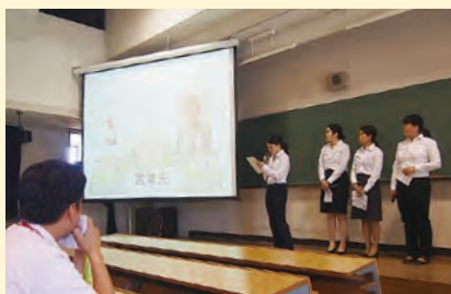
福岡女学院大学での「お RICOH 部」のプレゼン

選を経て、各校上位二チームが八月五日の福岡女学院大学における決勝に進出！というコンペ形式のプログラムです。本学からはチーム「初志貫徹」と「お RICOH 部」が福岡行きの切符を手に入れました。残念ながら決勝での入賞はかきませんでしたが、PBLを通してリコージャパン本社を訪問したり、同社社員の方へインタビューしたり、評価軸に則ってスライドやクリアファイルのデザインを考えたりすることで、「働くことへのイメージがポジティブに変わったようです。また他大学の学生がプレゼンテーションする内容やスキルに刺激を受け、さらに社会に行くには、どんな力が自分には足りないのかに気づき、新たな課題を意識する機会となりました。英和生の伸びしろに驚かされ、無限の可能性を感じた数ヶ月でした。