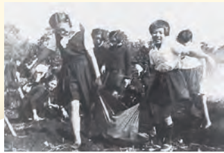
小学科: 花岡学院“林間学校用地”借用の 郊外農園