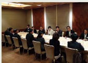
高等部部門の分科会