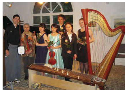
2015年5月27日 ドイツ パート・ゼーゲベルクでの第25回日独青少年交流コンサート