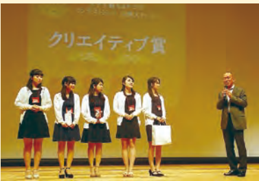
「まちづくりコンテスト」表彰式にてクリエイティブ賞を受賞