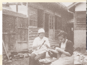
師範科：群馬県嬬恋村農家での勤労働員