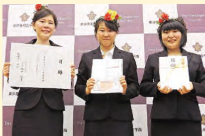
学内プレゼンで優勝した「初志貫徹」チーム