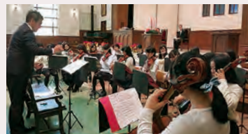
大学オーケストラ部の奉奏