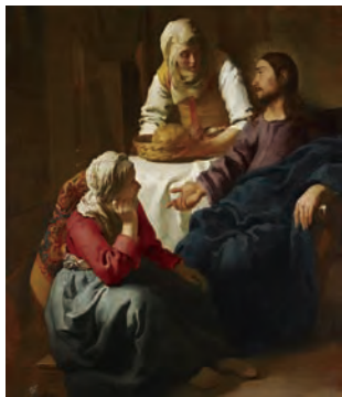
ヨハネス・フェルメール 「マルタとマリアの家のキリスト」