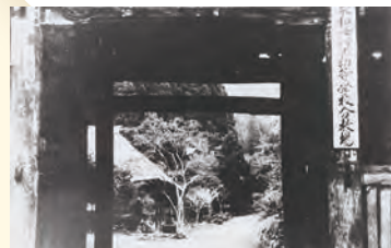
栃木県下都賀郡寺尾村出流山満願寺 山門の表札「東洋永和女学校初等学校分教場」