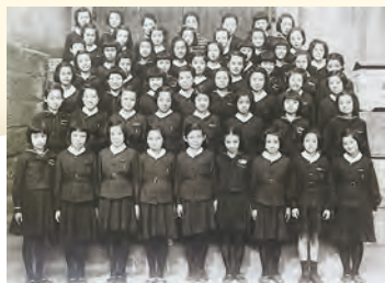
1942年入学高等女学科1年2組： 国民服（冬服制服）