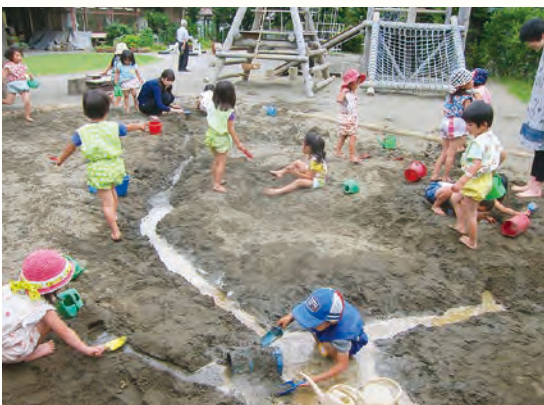
砂場遊びをたのしむ子どもたち

砂場は、一人で黙々と砂に向き合う場でもあります。夢中になって心を開放していくうちに他の子どもとのふれ合いや出会いが生まれる場所です。園にはそのような場がここにあり、交わりの物語が生まれています。