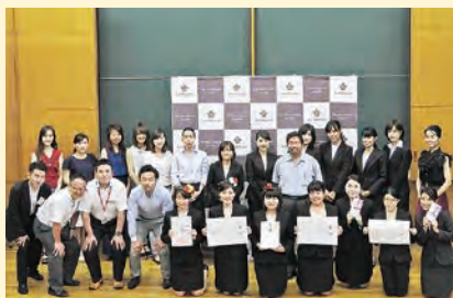
学内選考でのE I W Aプロジェクト参加者集合写真

本プロジェクトは、今年度学内公募で採択されたPBLのひとつです。E I W Aの頭文字にはそれぞれ意味があり、EはEnlightening、IはInteractive、WはWonderful、そしてAはActiveです。新規プロジェクトにもかかわらず、無謀にも三大学合同オープンPBLに挑戦。実践女子大学、福岡女学院大学とともに、クライアントであるリコージャパン株式会社からのテーマに取り組みました。チーム対抗課題の仮説検証、解決策の提案についてスライドを使って説明し、そして成果物であるスケジュールのデザインを発表します。で中間発表、七月二三日に本学での学内予