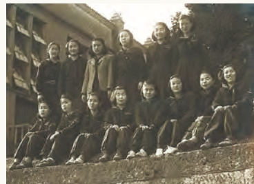
1945年3月11日撮影(後列左端が下山田さん)

皆、愛国心、愛校心旺盛で、罹災や疎開で転居した遠いところからセッセと学校工場まで通っていたものだ。