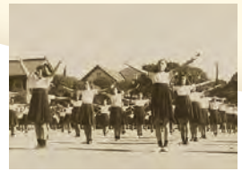
運動会にて高等女学科2年 女子青年体操