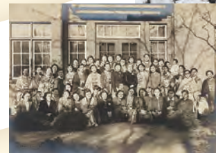
ミス・レーマン送別会

校名を東洋永和女学校と改称 小学科を附属初等学校と改称 校名に敵性国イギリスを表す「英」 の文字が入っていたことから、1941 年3月15日東洋永和女学校と改称