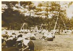
宮城外苑勤労奉仕一草取り