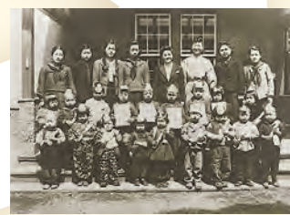
1945年3月戦時保育所早目の修了式 （1944年11月開所、近所の疎開できな かった幼児）