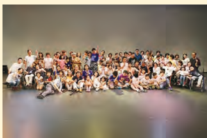
石巻・東松島のみなさんとの公開ワークショップ (せんだいメディアテーク：2015年8月)

と私から声がかかる。そんな時、自閉症の子どもが目をあわせずに近寄ってきてくれる。現地の母親たちから「来てくださってありがとう」と、ただ在ることへの感謝が告げられる。緊張は緩み、差し出された手に手を重ね、おぼろげと表現し、やがて笑顔になっていく。「何もできない自分を知る」、その身体感覚は大学内では決して学べない。将来、子どもと共に生きたいと願う学生たちである。人と人との存在の対等感を自らの身体で感じ、関係性から創出する表現の豊かさを実感した学生たちは、「また行きたい！」と申し出る。ワークショップの立ち上げから三年、年間を通じて参加するゼミ生や、継続して参加する卒業生は少なくはない。何もできない自分に素直に向き合い、他者と共に生きる意味とそのための学びへの意欲を築く：彼女たちの現場での成長は、眩しいばかりである。 (活動HP http://teawasekaken.jp/ )