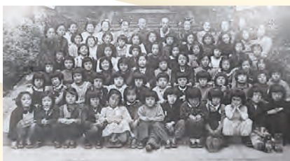
初等学校4・5・6年生