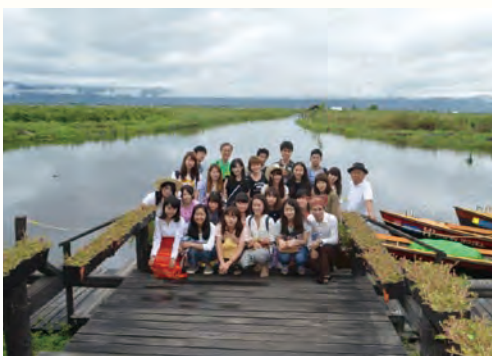
インレー湖畔にて

私が今回のミャンマースタディツアーに参加して学んだことは、自分の基準で物事を考えないことです。ヘーホー市場を訪れた際に、売り物である食品にたくさんハエが群がっていることや、生の肉を目の前でさばって売っていることなど、日本であれば不衛生であると、問題になってしまう