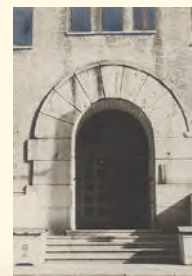
鉄柵と門燈は献納し、 防火用水設置