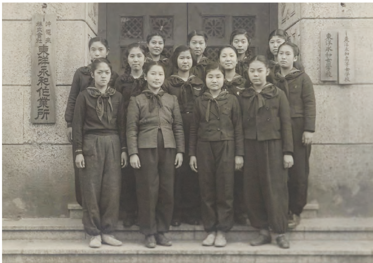
学校工場にて勤労働員（1945年3月卒業生卒業アルバムより）

1944年7月から高等女学科の3年生以上は、学徒勤労働員として学校工場あるいは都内の工場に出勤しました