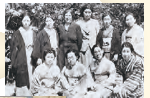
ミス・ケギーお別れ