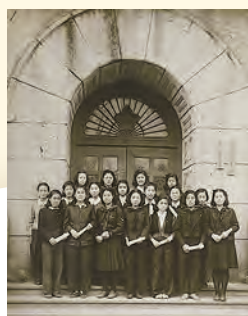
1946年3月高等女学科を4年で 卒業