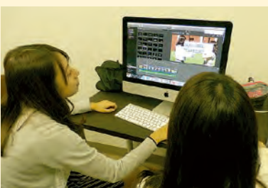
「映像プロジェクト」の編集風景