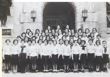
1942年入学高等女学科1年2組： 国民服（夏服制服）