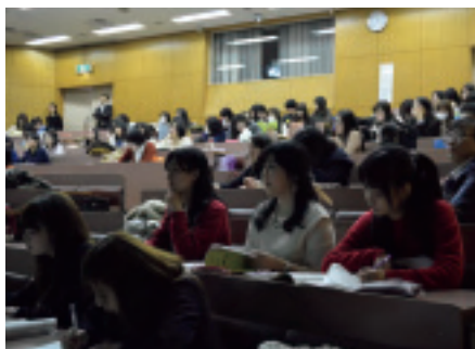
学生も教職員も熱心に聞き入る