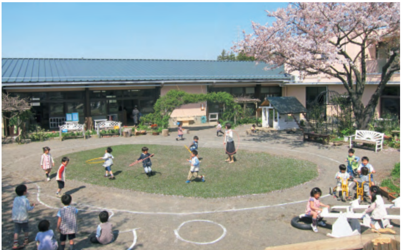
大学付属かえで幼稚園

TOYO EIWA JOGAKUIN Public Relations Report