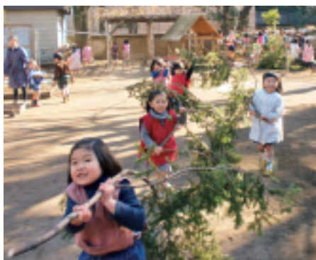
切り倒したもみの木の枝を運ぶ子どもたち

幼稚園は、創立一〇〇周年事業のひとつとして、園舎の増改築を予定しています。そのため、砂場右手の築山に立つ一本のもみの木も伐採されることになりました。