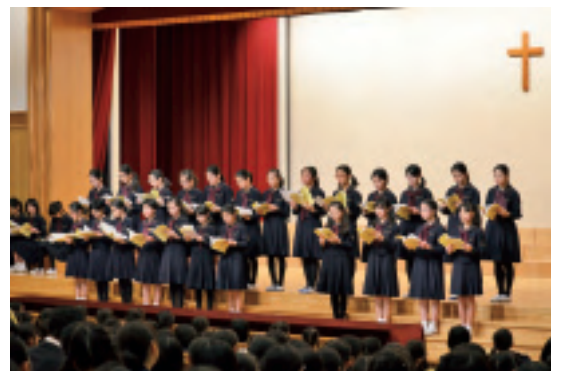
私たちの思いが届きますように

今年のマグノリアコンサートは、小学部で毎月十一日にささげている祈りにメロディーを添えた「祈りをともに」東日本大震災を受けて「」を全校児童と先生方の合唱をもって締め括られました。五年生の曲目も震災がテーマとなつていましたが、私たちの祈りが、気持ちが、今尚苦しみの真ただ中にいる人たちの心に届くよう、心をこめて歌いました。