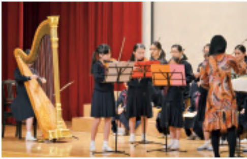
有志の子どもたちによるオーケストラ