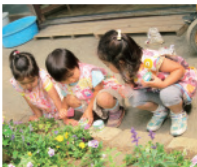
ダンゴムシを探す子どもたち

四月、三歳児クラスの子もたちにとって初めての幼稚園生活が始まりました。幼稚園を楽しみに登園する子ども、お母さんから離れて過ごすことに不安を感じている子ども、子どもたちの姿はさまざまです。私たちは進級した子どもたちも、新入園の子ももたちも幼稚園で安心して過ごしていけるよう、一人ひとりの子どもたちの気持ちに寄り添いながら、日々の生活を支えています。