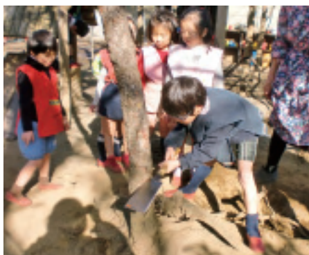
生木のもみの木を皆で協力して切りました