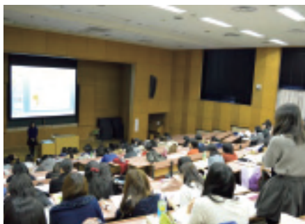
口頭発表への質疑応答