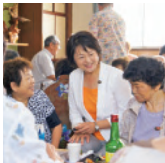
お年寄りのカラオケ大会に出席

ら芽生えたある一つの思いが、徐々に自分自身の信念へと変わっていった。「人生の前半は自分のために生き、好きなことをやり、人生の後半は他者のために、社会のために生きよう。」このような思いが結実し参議院議員選挙への出馬となったのである。私にとって国会議員という職は、他者のために人生を費やすことであり、社会のために尽くすことを意味している。思いは人一倍ではあるがまだまだ実践できていないことが多い。英和で学び教えて頂いたことへのお返しができるよう、感謝の気持ちを忘れずに日々を過ごしていきたい。