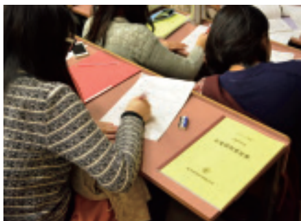
配布された要旨集を読み、発表を聞いて意見を記入中

人間科学科の総合人間学コースの卒業研究発表会が一月二十九日(水)に行われました。このコースの七八名は七つのゼミ(演習)で卒業研究に取り組んできましたが、四年次の終わりに卒業研究成果(卒論)を提出するだけでなく、全員がポスター発表(カルテットホール二階)をしなければなりません。そのなかからさらに、ゼミ代表の七名が口頭発表を八号館の階段教室で行いました。