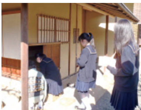
蹴り口から身をかがめて小間に入ります

てくださった方に感謝しながら、「お点前頂戴いたします」、そのような声掛けが素敵だなと思いました。緊張して、お菓子を床に落としてしまう生徒もいましたが、無事終了。いよいよ小間に移動し、濃茶をいただきます。蹴り口は狭いので、かがみこんで小さくなつて入ります。自分の脱いだ靴を片付けられないので、次に入る人が前の人の靴を片付けます。みんなでぎゅうぎゅう詰まって小間に入りました。中はまるで異空間で、騒がしい外界から切り取られたような気がします。みんな足がしびれてつらそうな顔をしていましたが、よく頑張りました。最後まで涼しい顔で正座をしていたある生徒に卒業生の方が、「あなた、お茶をおやりなさいよ、奥が深いわよ。到達点がありませんから」とおっしゃっていました。