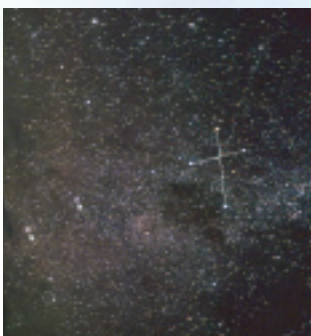
南十字とポインターの星(左 ケンタウルス座α星、右 ケンタウル座β星)

答えは「見ることができません」。しかし見るためには日本の中でも相当南に行かなくてはなりません。南十字の四つの星がギリギリ地平線・水平線上に昇ってくるのは、北緯二七度の与論島付近、または小笠原諸島でしたら父島付近です。そこから緯度が一度下がると南十字星も一度高く見ることが出来ます。