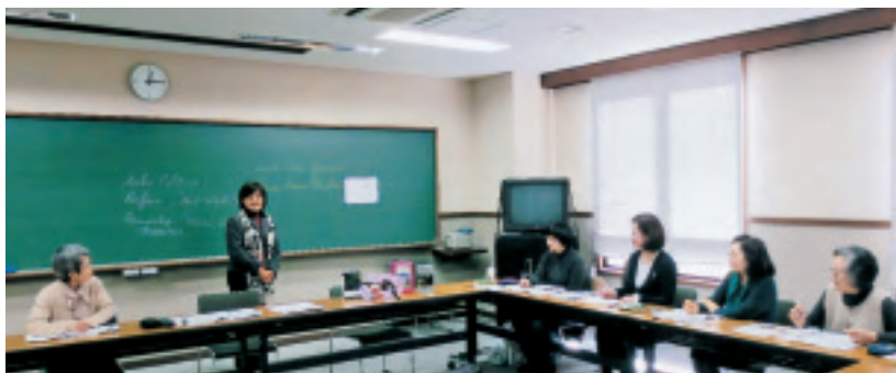
人と本との出会いの輪の中で

アメリカの中短編小説を中心に原語で読む読書会の、今までの内容を一部紹介します。毎年、一つの切り口があり、そのテーマに関連する作品を選択します。家族…アップダイクの「別居」、ギルマンの『黄色い壁紙』他、アジア系作家…タンの『ジョイ・ラック・クラブ』、ヤマモトの「十七文字」等です。ト