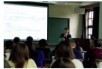
公開連続ワークショップ 「国際協力NGOの広報・啓発・資金集め」

六本木にある大学院では、国際協力にかかると公開ワークショップが毎年開催されます。