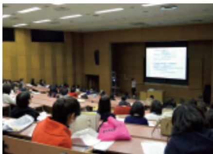
8号館階段教室でゼミ代表の口頭発表