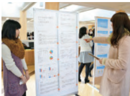
ポスター発表会場