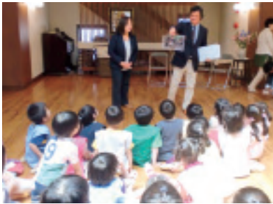
オヨンクンの写真をじっと見る子どもたち

その後再び、五歳児の子どもたちと交わりの時を持ちました。「なべなべそこぬけ」のわらべうたを歌って踊った後、アルバートさんは写真を用いて、寺子屋