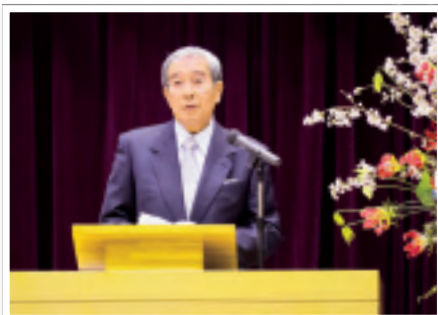
2013年4月2日 大学入学式