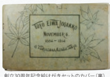
創立30周年記念絵はがきセットのカバー(裏)

東洋英和では、おもに校舎の新築・改築や移転の際に絵はがきを作製してきました。並べてみると一七種類もありました。