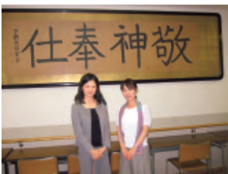
KAEDE Magazineの取材で英和を訪ねた際の一枚

法科大学院を修了して一回目の司法試験は不合格。そこから二回目の司法試験までの約八ヶ月は、朝六