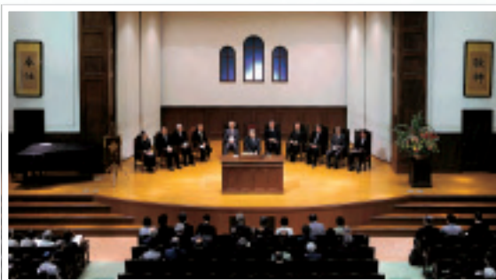
2007年5月11日 院長就任式