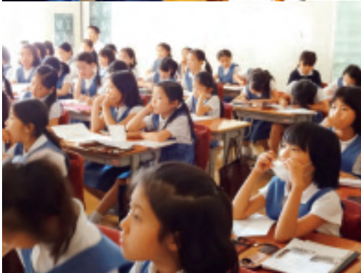
(上)お母様、おばあ様方へお礼 (下)熱心に聞く3年生