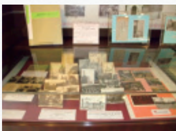
絵はがき展 展示一部