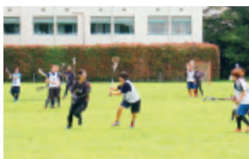
東京女子大学とのスポーツ交流会 ラグロスの試合(黒いユニフォームが東洋英和)