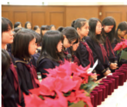
クリスマス献金をささげます

クリスマスには献金がありますが、各クラスで集め、クリスマス讃美礼拝でささげるのも委員の仕事の一つです。