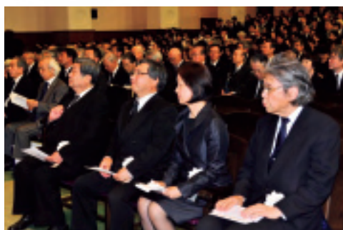
別れの言葉を述べてくださった方々