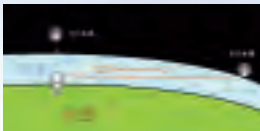
(図1) 高度の違いによる太陽や月の光の届き方