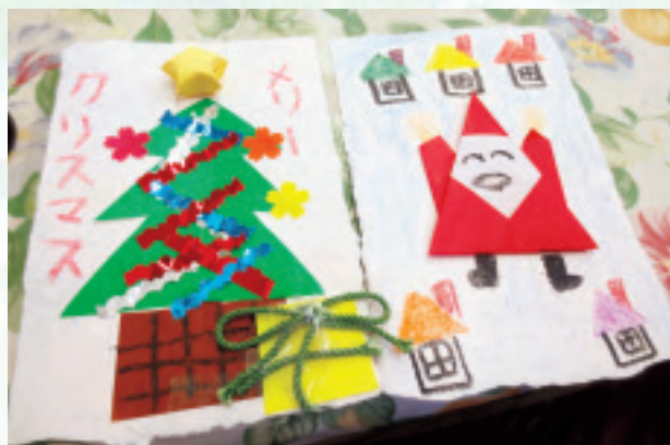
えだ福祉ホームさんでのクリスマス会で作ったクリスマスカード(参加した子どもの作品)。カードは福祉ホームの利用者さんが手作りしたはがきを使わせていただきました

かえで祭では、魚釣りコーナーや制作コーナーのほか、手作りおもちゃの販売も行っています。毎年魚釣りは人気で、幅