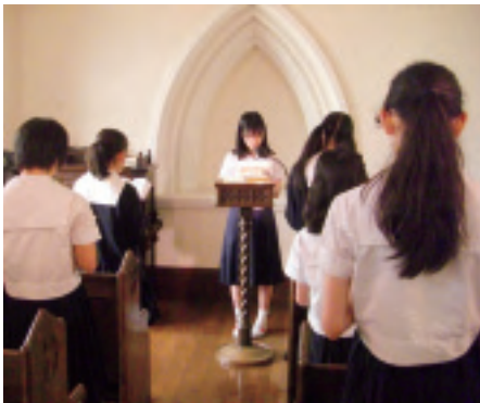
聖書輪読会:メモリアルチャペルで静かに祈りの時を持ちます

中高部では、毎朝礼拝を行っています。小講堂と大講堂に分かれて行われることが多いのですが、それぞれの講堂へクラスごとに移動する時、先頭に立って誘導しています。クラス単位で、各教室にて行われるクラス礼拝では司会を担当します。