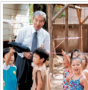
2009年9月 東洋英和幼稚園にて