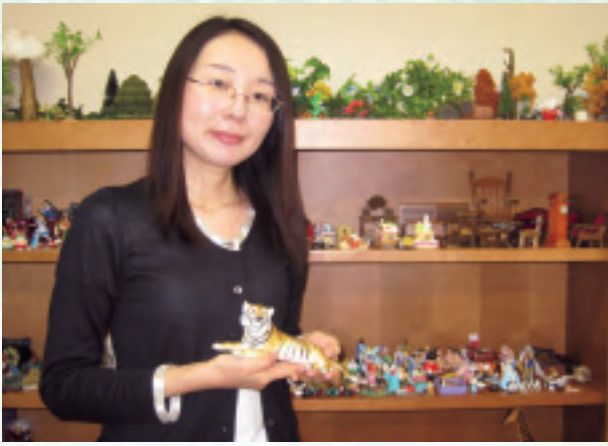
相談室は大学院棟地下2階にあります。静かで心落ち着ける空間になるよう配慮しています

私は今「東洋英和こころの相談室」で心理士として働いています。電話の受付に始まり、窓口での対応、初回面接、継続してお会いしていく面接といった、相談室に來られる方々とさまざまな形で接する仕事の他に、臨床心理学領域の大学院生の実習を、相談室という「現場」でサポートするという役割も持っています。