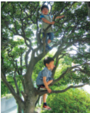
木登りする子どもたち

す。ヤマモモの木の隣には、イチヨウの木があります。子どもの視線の高さに、太い枝があり、