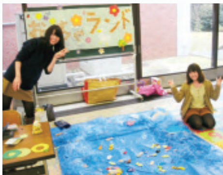
「おもちゃランド」準備風景。魚釣りは大きなビニールシートを海に見立てて遊びます

広い年齢の子どもたちが夢中になって魚を釣る様子が見られます。また制作コーナーでは参加した子どもの興味や発達に合わせて取り組めるよう、授業や実習での知識や経験を生かしながら、活動を進めています。