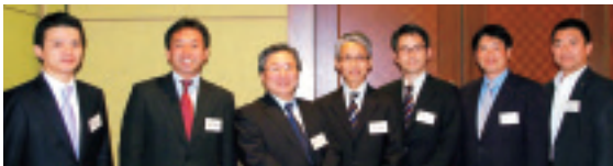
後援会常任役員の方々

総会では金子栄一後援会会長挨拶、村上陽一郎学長・副院長挨拶の後、学院出席者紹介、役員会審議事項の報告、退任・新任常任役員挨拶などが行われ、その後学院各部代表者より現状報告がありました。また、懇親会では、なごやかな歓談の時を持ちました。