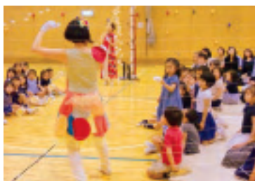
糸と紙コップで作られた楽器

親元を離れ軽井沢追分寮で生活を共にしました。庭でキャンプファイヤーをしたり、散歩に出かけました。