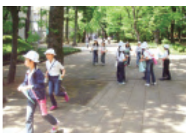
春の遠足～オリエンテーリング～