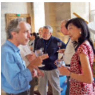
パリ天文台で行われた国際学会のレセプションにて

私がこんな宇宙の世界をどこまでも知りたいと、最初に思ったのは小学部の五年生の頃でした。時空を超えて想いを巡らせ、未知の宇宙にどこまでも挑む天文学者―それは私の人生最大の夢となりました。日本には女性の天文学者は少ないのに、どうしてなろうと思ったの、と学生どきにシカゴ大学の教授の奥様から尋ねられたときの事です。それは東洋英和で育ったからだ、とふと思いました。小学部で私は、理科を専任の先生に教わりました。理科を愛する気持ちに溢れた先生のお話は、当時の私にはとても新鮮で、私