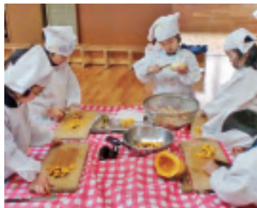
かぼちゃ、たまねぎ、にんじん、なす…子どもたちが野菜の皮を剥き、細かく切りました

を加え、グツグツ煮込むとカレーの香りが幼稚園に漂いました。「家でお母様が作るカレーと違う。スープみたい」「辛くないね。おいしいね」「バングラデシユの人たちは毎日カレーを食べるんだって」「スープみたいなのに手で食べるの?できるのかな?」