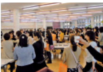
人間福祉学科閉学科懇親会