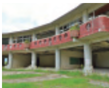
被害の大きかった 大川小学校