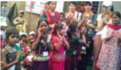
現地での交流で多くのことを学びました

大学の最大の魅力のひとつにゼミ合宿があります。ゼミによってやり方は様々です。国内だけでなく、海外にでかけて合宿することもあります。いずれの場合も、教室では得られない貴重な経験をすることができます。同時に、ゼミ生との友情を育む良いチャンスにもなります。国際社会学部では途上国の開発問題が大きなテーマで、幾人かの先生のゼミは東南アジアでゼミ合宿を行っています。