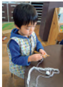
ていねいに時間をかけて、満足いくまで続けます

ちは、紙や空き箱での制作もおおいに楽しんでいますが、木工も好きになり、喜々として木工室まで出向いて行き、ノコギリで挽く(切る)ことや金づちで釘を打つこと、くりこぎりで穴をあけることなどを組み合わせて、つくることをします。二〇一二年度、保育者がやすりで木を磨くことのおもしろさをあらためて見直したこともあり、その思いが反映してやすりかけに深く関わり「すべすべになった」とその感触を楽しんでいる子どもたちも多くいます。