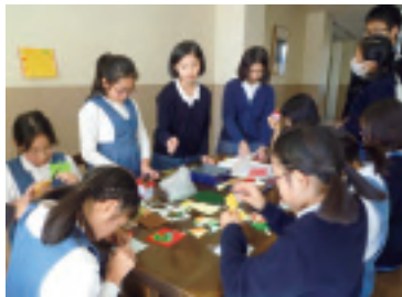
仮設住宅への贈り物づくり