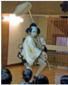
日舞を観る会 演目「大原女」

三九名の子どもたちが卒業いたしました。ご家族の方と共に礼拝を守り、保育証書授与を行いました。