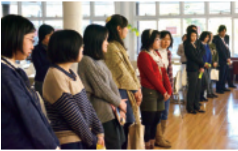
「読後のつどい」を終えて、高校生との交流会