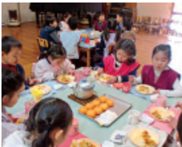
4歳児・5歳児一緒にテーブルで「チャーもカレーもおいしいね!」とたくさん食べました

子どもたちが切った野菜、肉を、ターメリックと和えました。入れていくうちにどんどん黄色くなっていき、クミン・ローリエ・シナモン・カルダモンなど