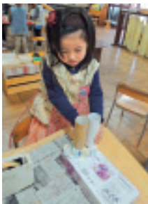
空き箱や紙をこつこつ、ごそごそとつなげ合わせ、つくる楽しさや何かに見立てる楽しさを味わいます

ごそごそとつくり、その楽しさを知っていき繰り返します。つくることの好きな子どもた