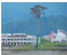
奇跡的に残った 一本松

二〇一二年三月十一日に起きた東日本大震災。未曾有の被害に大きな悲しみを受けた方々への思いを忘れないように、小学部ではさまざまな取り組みを続けています。