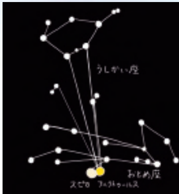
5万年後のうしかい座とおとめ座

今年はおとめ座のスカートの裾のあたり、★印の位置に土星が見えています。来年の今頃には東隣のてんびん座に移動します