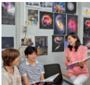
研究室の学生たちとキャンパスで

「あすのことを思いわずらうな」(マタイ第六章三四節)という聖書の一節です。誰でも人生の先が見えなければ、不安な気持ちになりますし、リスクを想定して対策も立てます。ただ、まだ起こってもいいことで悩んでも、事態は好転しません。それよりも、とりあえず一歩足を踏み出せば良いのです。だからもし、英和生の皆さんも人生をかけた夢に向かって歩みを止めず諦めないことが、結局は夢への近道です。神様はそんな皆さんをしっかり見守って、エールを送ってくださるはずですから。