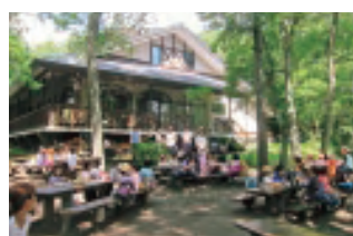
寮の庭にて、木もれ陽を浴びての昼食のとき

池の平湿原でのハイキングの他にも、JA見学や追分の歴史を学ぶ活動などを通して、充実した四日間を過ごすことができました。