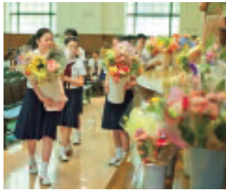
礼拝後、ステージに飾った花束を持って、高齢者施設を訪問します