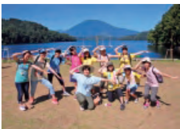
野尻キャンプ 卒業生リーダーとともに

今年のテーマは「COME TOGETHER」。各クラブが、大講堂のステージや教室展示等で活動の成果を発表しました。入場者は五八六一名でした。