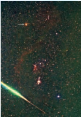
オリオン座としし座流星群大火球。矢印の赤い星がベテルギウス(撮影地：東京都大島町/撮影：北崎直子)