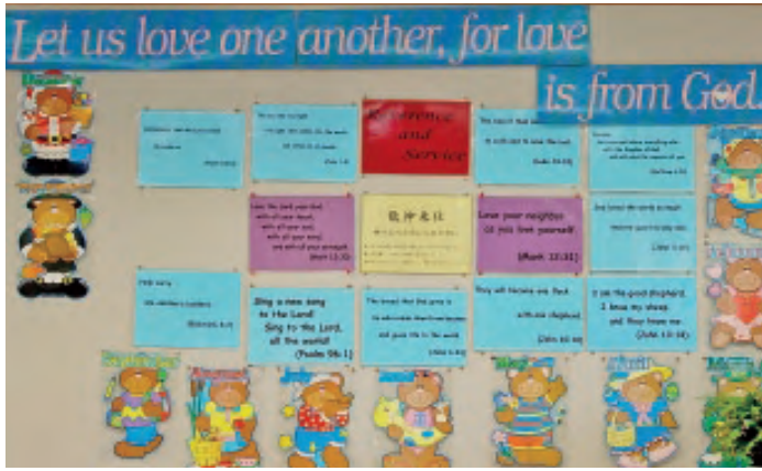
小学部英語室の壁