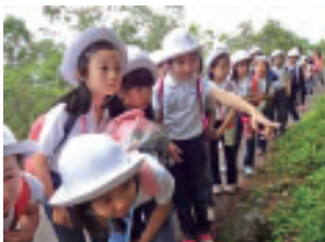
3年 ヒカリゴケを発見

えての行動をがんばることができました。遠足では、鬼押し出しのハイキングコースを楽しく歩きました。 四年生は、自分たちでプログラムの司会や進行を上手に進め、楽しむことができました。碓氷峠の山道は少し苦しかったけれど、上から景色を眺めたときは、達成感でいっぱいになりました。 五年生は、自分たちでほとんど考えて、よりよい生活をつくりだすことができました。