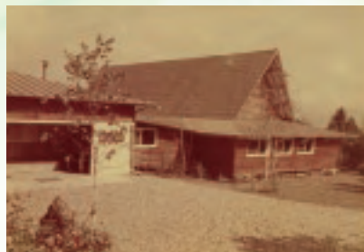
1959年 旧追分寮竣工時