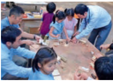
父と遊ぶ日 大工コーナー