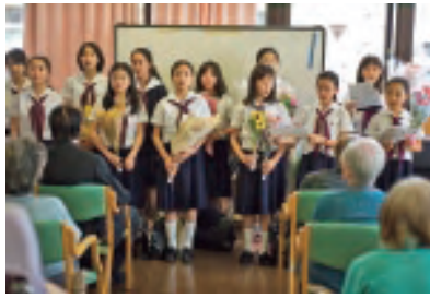
2012年 花の日訪問先での奉仕