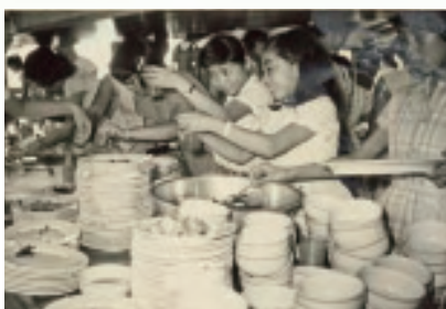
1960年度 中1夏期修養会 「お当番は大変でした」