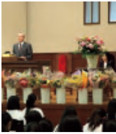
2012年 花の日礼拝の様子