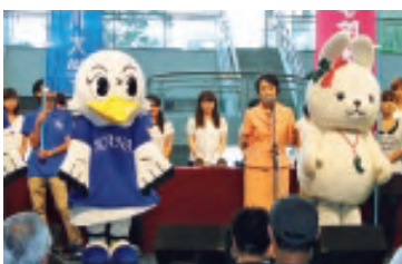
ヨコハマ大学まつり 学生パフォーマンスステージ (ハンドベル部演奏、中央は林文字横浜市長)