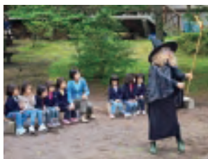
魔女に踊りを習いました