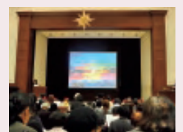
輝く天を仰ぎながらハレルヤコーラスが大講堂に響きました

同窓生を中心に始められた「桜プロジェクト」のDVDも上映され、敬神奉仕の思いでつながる英和の精神が集会室でのお茶の会にまで温かく流れた午後となりました。