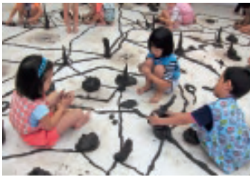
横浜美術館 子どものアトリエにて