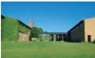
International People's College

(研修先:デンマーク International People's College)