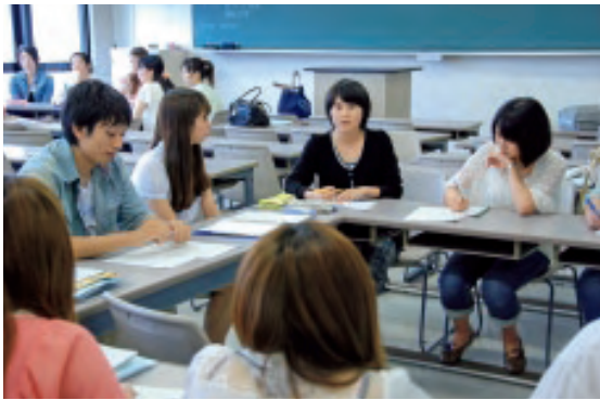
合同ゼミ(沖縄国際大学にて)

沖縄国際大学との合同ゼミでは「沖縄から基地はなくなるならいいのか」というテーマで話し合いました。一口に基地問題といっても現地で暮らす学生と、私たちの間ではその問題に対する考え方に大きな隔たりがあることを実感しました。事前の学習で基地が身近にあることによる危険性を学びましたが、現地には赴くと民家のすぐ隣には基地のフェンスがありました。過去に大学構内に米軍ヘリが墜落した跡まで残っていました。現地で暮らす方々の不安は、私が見てきた以上のものだと思います。沖縄に関連した話題は毎日のように取り上げられていきます。今回の合同ゼミで現地の学生と議論したことにより、基地問題をより身近に感じることが出来たのが、私にとって一番の収穫でした。