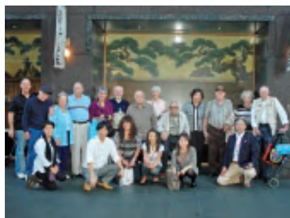
元捕虜訪日プログラム：離日前の記念撮影 (2012年10月21日)

に学ぶのは勇気と愛なのです。捕虜使役の社史を認め友情を交せば彼らの癒しとなる一方、国際社会に信頼される企業イメージとなります。人権感覚と人道的価値観を民主主義諸国と共有するところに、日本の、ひいては世界の平和が見えるのでは？ 友の死への自責等、苦しみを愛で乗り越えた方々は各々人として魅力に溢れ、日本人に戦時事実の共有と平和の尊さを訴えています。