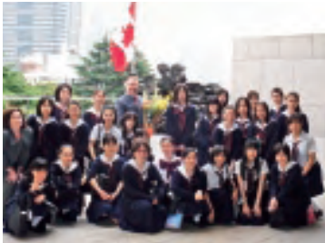
2009年 カナダ大使館花の日訪問 "YWCA"の生徒と共にカナダ語学研修旅行に行く予定の生徒も参加しました