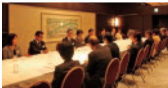
大学部門の分科会

10月5日(金)、後援会役員懇談会がANAインターコンチネンタルホテル東京で開催され、出席者数は学院側も含め約110名でした。学院全学部を8つの小グループに分けて行われた各分科会において、通学時の安全確保、災害に対する備えなどを含む学院生活について、後援会役員と教職員が活発に意見交換を行いました。