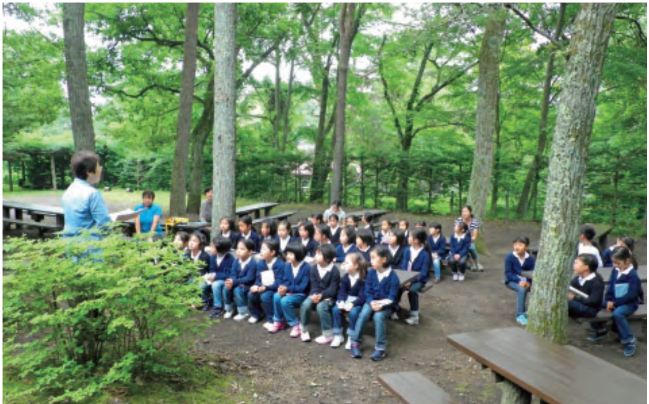
小学部夏期学校「1年 朝の礼拝」

夏期学校の1日は朝の礼拝から始まります。清しい空気に包まれて神様を賛美できることも、夏期学校の魅力の一つです