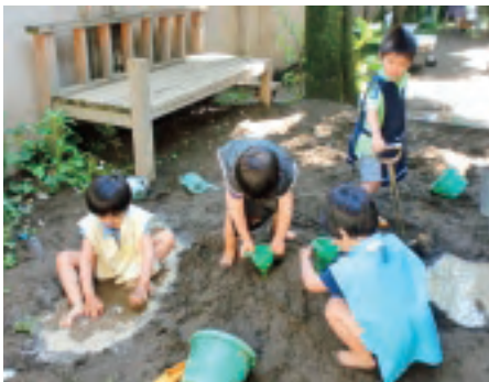
裏庭で遊ぶひよこ組の子どもたち

幼稚園生活を送る中で、子どもと保育者、子どもと子ども、保護者同士、それぞれの関係が深まります。少人数だからこそ、何でも言える関係になりときに手が出て喧嘩をして悲しい思いをしつつも、それ以上にみんなでいる楽しさを感じます。幼稚園にながらも家庭的な雰囲気の中でたくさんの思いを共有します。さまざまな経験をし、思いを出し合いながら一年を過ごし、成長していきます。