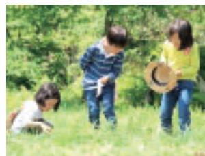
原っぱで自然を満喫する子どもたち

神様のお守りの中、自然や人との出会いを通して貴重な経験をし、一回り成長して帰ってきました。三日目は、窓から緑が見えるチャペルで感謝の礼拝を守りました。家庭へのお土産は寮近くの店、寿美屋さんが追分の旬の果物で手作りしたジャムを届けてくださいました。制服に着替え、昼食後帰路につきました。東京駅で家族が迎えに来てくださりお互いにホッとした表情を浮かべていました。