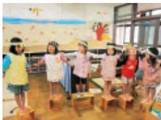
絵本「こすずめのぼうけん」より一羽をひろげて飛び立とうとしているすずめたち—