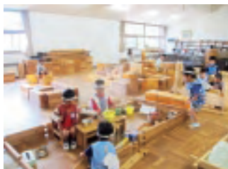
ホールにて、積み木で家をつくり、すずめごっこをしている子どもたち

かえで幼稚園で繰り広げられているたくさんの遊びの中に、子どもがなりきって楽しむ遊びがいくつもあります。保育室のままごとの場や庭の木陰や芝生の上で、お母さんやお父さんになって家庭の日常のドラマに空想を含めたお家ごっこをする子どもたち。積み木やダンボールで家や乗り物を作り、その中でうさぎやライオンやねずみ等になってごっこをする子どもたち。お店屋ごっこや、レストランごっこなどでも、子どもはその役自然になりきり、そのおもしろさを味わっています。