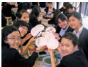
中1オリエンテーション 恒例のお血に絵付け 祈り、愛等好きな言葉をいれて

が被災者のためにできることを考えました。二日目には中軽井沢の湯川ふるさと公園の清掃ボランティア体験もしました。夜は追分寮のながい廊下をつかって恒例「スイカ割り」もしました。みんなで歌った「虹のやくそく」の最後のフレーズ「虹の約束、不思議な導き、信じる心が僕らを支える。明日を信じ、空を見上げ、物語を紡ごう」のように、明日を信じ福島の人々との物語を紡いでいきたいと思います。