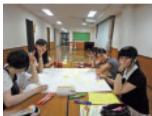
夏期修養会 福島の方々をお招きする企画について話し合いました