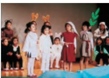
学芸会 2年生「にじを見つけたら」

一・三年は合唱、五年は英語発表、二・四・六年は劇の発表をしました。一人ひとりが精一杯力を発揮することができました。