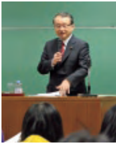
中川正春元内閣府特命担当大臣講演会 「多文化共生社会を目指して ～難民受入れを中心に」

現代の国際社会はさまざまな問題を抱えています。先進諸国や新興工業諸国は、二〇〇八年に生じたリーマンショックの影響からまだ立ち直れず、経済の低迷が続いています。開発途上諸国では、飢餓、貧困、難民などの諸問題を抱え、紛争が絶えない状況にあります。アラブ諸国に