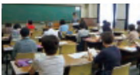
「ジェイン・オースティン・クラブ」講座(六本木校地)