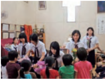
2009年 "YWCA"「のぞみの家」花の日訪問