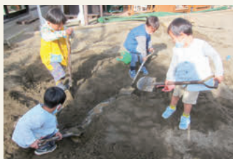
スコップで穴を掘る年少組の子どもたち

えで幼稚園には広い砂場があります。砂場では年少組から年長組の子どもたちが交ざり合っていて思いおもいに遊んでいます。年少組の子どもたちは、1学期、2学期の間はプラスチックのシャベルで穴を掘ったり、砂をすくったりしながら、年長組や年中組が金属製の大きなスコップを使って掘っている様子を見ていました。3学期になっていよいよ年少組の子どもたちも金属製のスコップを使い始めました。