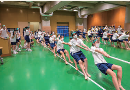
体育館Aの中学生の綱引き

代替イベント スポーツフェスティバル 体育祭の中止を発表した直後から 生徒の体育祭実行委員会の中からは 代替行事の開催を熱望する声が多く 上がりました。コロナ禍「だから」 しかたがないではなくてコロナ禍 「だけど」できることはないか、そ