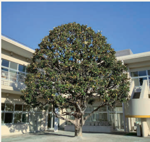
朝日を浴びたタイサンボク

3年生になると、子どもたちは「いつタイサンボクに登れるかしら」とわくわくします。でも、すぐには登ることができません。子どもたちが、初めてのクラス替えと3年生の生活に少し慣れて落ち着いた頃に、3年生の両担任で話し合い木登りを始めるようにするので。木登りには、いくつかのルールがあります。例えば、木の幹の周りを枝から枝へと飛び移ってはいけません。また、幹や枝にペンキで記された線より先へ行ってはいけません、というものです。木登りは、非日常の「高い世界」を味わえる楽しい遊びであると同時に、危険を伴