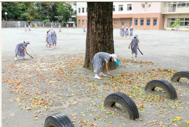
銀杏拾いのお手伝い

2000年に小学部校舎が改築されて新しくなりましたが、小学部のイチヨウの木は健在で同じ場所にあります。校庭に2本、校門そばに1本あり、校庭のイチヨウはタイサンボクと並んでとても素敵な小学部のシンボルツリーになって