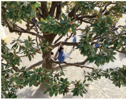
毎日、子どもたちを見守るタイサンボク

こんなことを教えられました。「タイサンボクは、本来とても大きく生長する木だけれど、小学部のタイサンボクは子どもたちが登りやすいように低い所から枝が生えていて、それを横へ広げてくれているのよ」私は、それを伺い、何十年もタイサンボクに登ってきた小学部の子どもたちとその子どもたちを支え続けたタイサンボクとの歴史を木の形から感じる