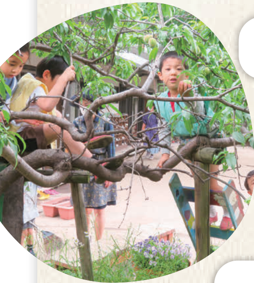
東洋英和幼稚園 桃の実を 木に登って収穫