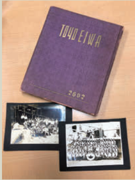
皇紀2602年(西暦1942年)の卒業アルバムをご寄贈いただくことにより、欠号が補完されました。

中には、お気遣いから、お手元に置いておきたいものまで送ってくださるうとする方もいらっしゃいます。が、あまり断捨離しすぎないように、よろしくお願いいたします。