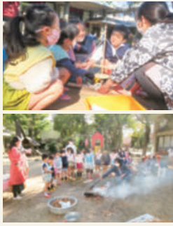
上/力を合わせ交代で火おこし器を回す 下/「火がついた！」