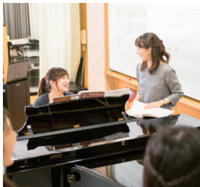
学生一人ひとりに寄り添うきめ細かな少人数教育で、専門的なスキルもしっかりと身に付く

学士号を取得する4年制大学として、実践的なスキルだけでなく、学問的な知識を身に付けることも重視しています。学生たちは、4年かけて保育・教育について多面的にとらえ、社会的な課題の解決法や自分が目指す保育についてじっくり考えることができます。