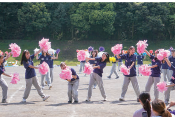
4年生によって代々受け継がれている学科全員参加の運動会イベント「ブレイデー」

えで幼稚園はもちろんのこと、強いつながりのある園や施設では卒業生が働いています。実習生に対して理解のある受け入れ先で教育・保育実習ができるのは保育子ども学科の大きな特徴の一つであり、学生が安心して実践を積めるのは何より