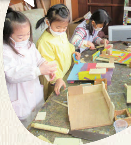
東洋英和幼稚園 木工室で工作。 木で何を作ろうかな?

東洋英和女学院大学の人間科学部保育子ども学科では、子どものための教育とケアを総合的に学ぶことができます。教育の特色として、体験的な学びや実習で実践力を養い、「子どもと国際」「子どもと感性」「子どもと心理」の3つのコースで学生の適性や興味に応じたスキルを高めます。建学の精神「敬神奉仕」に基づいた伝統を継承し、教養と豊かな人間力を備えた保育者を養成しています。