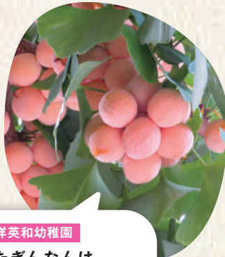
東洋英和幼稚園 実ったぎんなんは 七輪で炒って食べます