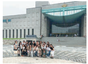
コロナ禍の前は、韓国でのゼミ合宿を実施していました

ソウル大学校政治外交学科政治学専攻修了。政治学博士。2019年4月に着任。趣味は、韓国ドラマ鑑賞、料理。食べることが大好きなので、休日に韓国料理を作って楽しんでいます。