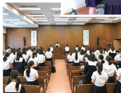
YWCAの活動 まずは礼拝から！ 活動の前には生徒有志で 礼拝を守ります