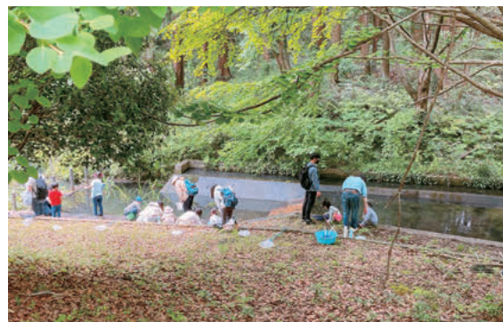
キャンパス内にある自然豊かな「英和の森」。子どもと保護者を招待した自然遊びなども行われる

愛情をかけて育てられた東洋英和の学生が苦勞してまで保育、福祉関係の仕事に就かなくても……と考えるかもしれません。しかし、恵まれた環境で育ったからこそ、社会で果たすべき役割があり、多様な人々に寄り添うことができるのではないのでしょうか。保育の人材育成は、国や社会の基盤となるものです。これからは、子どもたちの幸せを考え、成長を見守る保育者の仕事に誇りを持ち、社会貢献できる学生を育成していきたいと考えています。