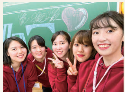
かえで祭実行委員会のメンバーと

大きく分けて2つあると思います。1つは、学生が英和生としての自覚を持つことができることです。学年や学科の枠を超えて、大学全体で1つの目標に向かって活動ができる機会は他になかなかありません。英和生みんなが一致団結することができる貴重な経験をすることができたと思います。もう1つは、一人ひとりが成長できる場であるということです。私自身、一人ではどうすることもできない問題に直面することもありました。ですが、仲間と力を合わせることで解決策を見つかったり、新しい視点を発見することができたりしました。実行委員の経験を通じて、改めて仲間の存在のありがたさに気づかされました。自らの意見をきちんと発言することや協調することの重要性も学ぶことができたと思います。 —終了して思ったことは何ですか。