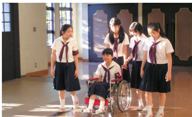
中1ディアコニア クラスのグループメンバーと楽しみながら体験して学びます

また、中1は年8回ディアコニア活動を行います。ディアコニアはギリシア語で「人に仕える」という意味で、点字・車椅子の体験学習や施設訪問などを通して、奉仕を実践するために必要な知識や技術を学びます。