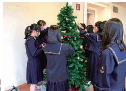
宗教活動委員会 アドベントの準備として 校内クリスマス装飾

キリスト教精神を生徒の立場で実践している組織が、YWCA（キリスト教女子青年会）と宗教活動委員会です。YWCAは世界YWCAのプランチとして、宗教活動委員会は生徒会の一つとして、共にキリスト教活動の展開を目指し、「敬神奉仕」の精神を具体化するために有志の生徒が活動しています。活動には、児童養護施設でのボランティア活動、自然災害などの被災者支援活動、福祉施設への献品の募集・発送などがあります。