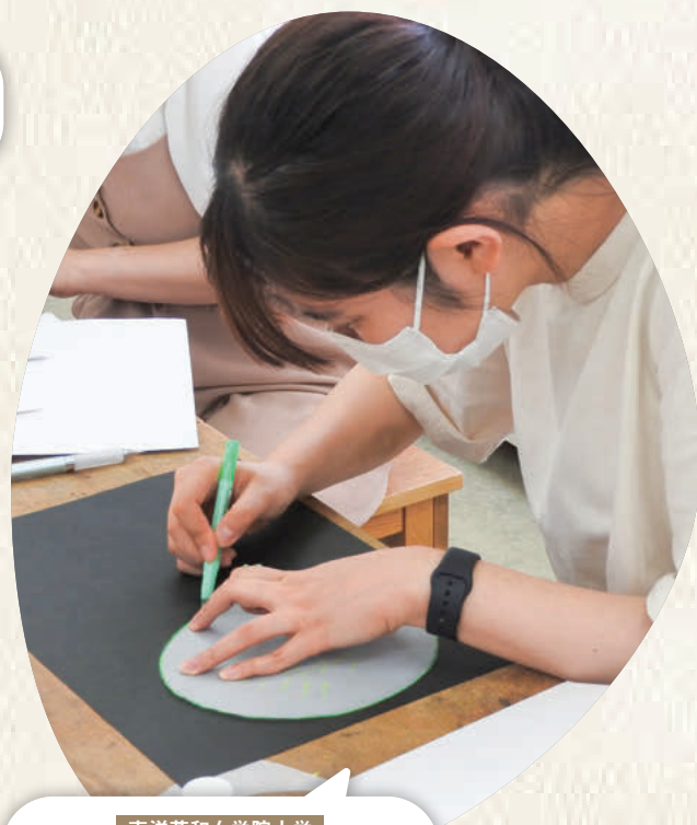
東洋英和女学院大学 子どもが喜ぶ顔を想像して おもちゃを手作り

東洋英和の幼児教育は、1914年、女学校生徒の弟妹のための園として東洋英和女学校附属幼稚園（現、東洋英和幼稚園）が創立したことに始まります。その後、1973年に東洋英和女学院短期大学付属かえて幼稚園が開設（現、東洋英和女学院大学付属かえて幼稚園）。神の愛と恵みのもと、一人ひとりの自発性、創造性を大切にしながら、自由に伸びやかに、その子らしい成長を促すキリスト教保育を行っています。