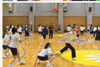
上/高校生の借り物競争 下/体育館Bの高1ドッジボール

応援合戦は昼に全校生徒が学校に いる時間帯を使ってグラウンドで行 い、高校1年生以下はGoogle meet を使って教室のモニターへと配信し ました。本来であれば広い大学のグ ラウンドで全校が一体となって盛り 上がるのですが、コロナ禍なら ではの一体感が得られ、会全体に華 を添えてくれたように思います。