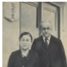
ガントレット夫妻