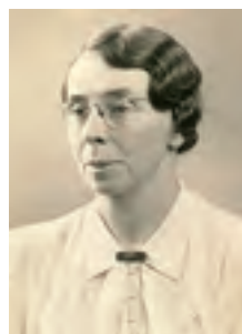
ミス・ハミルトン