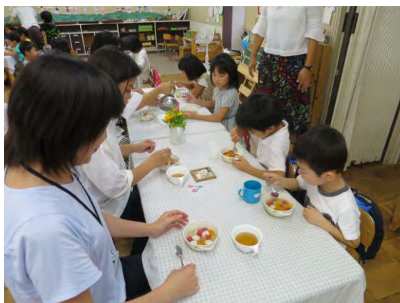
おやつはフルーツ白玉