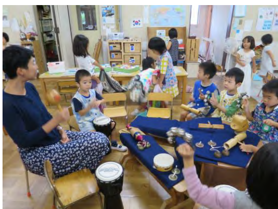
〈年長組〉 楽器は楽しい！