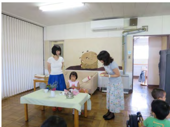
カードをもらって