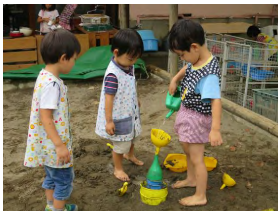
ちよつとでも晴れれば砂場！