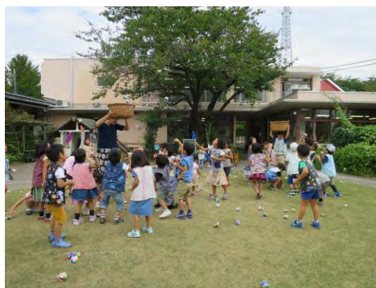
準備をする年長組がかごを持ちます。