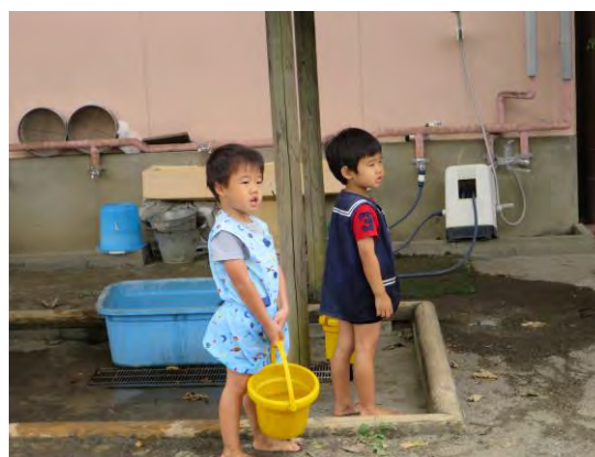
年少組も手を止めて見えています

他の遊びに夢中で、すぐには『きょうのうんどうかい』に入らない子どもや、まずはじっくり見ることで参加している子どももいます。そのような子どもたちには、集まりの時間にクラスのみなですることがやってみるきっかけとなります。この時期、どの子どもも、体を動かすことを気持ち良いと感じることや、ルールのある遊びを共にすること体験ができるようにと思っています。(かえで幼稚園保育だより 2016年10月号より)