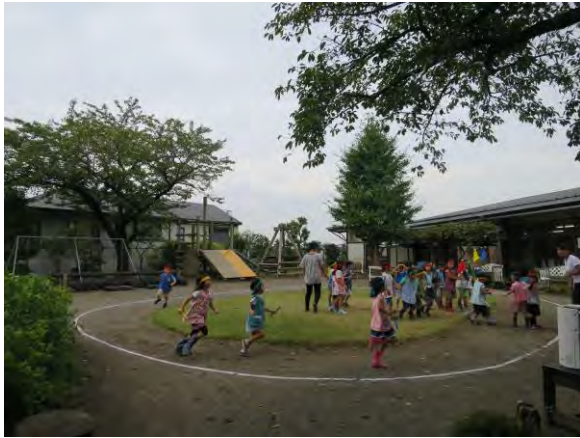
年長組 クラスでリレー

今年の『うんどうかい』が、どのように展開するか、そして個となかまがどのように育てられていくかを楽しみながら、関わっていきたいと思います。また、10月に予定されている、年中・年長組のファミリーデーや年少組のオープンデーでは、保護者の方々とも一緒に『うんどうかい』を楽しみたいと思います。(かえで幼稚園保育だより 2016年10月号より)