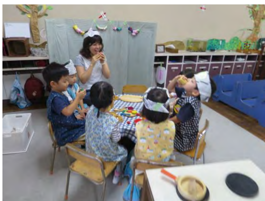
〈年少組〉 部屋でごっこ遊び