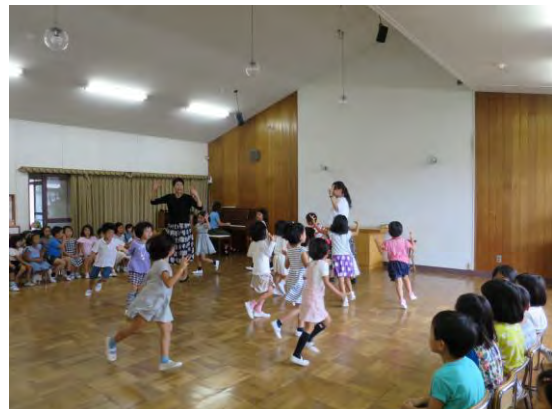
9月の誕生日会は年長組のキャンプで楽しかったことを分かち合います。