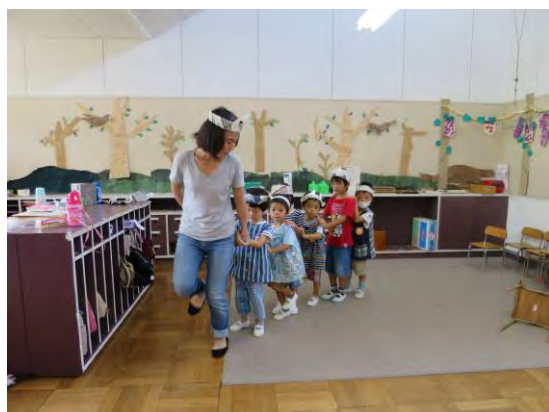
〈年中組〉 つながって・・・