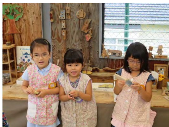
木工室でやすりかけ