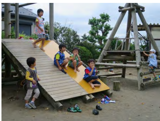
『うんどうかい』の様子を見ています。