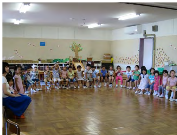
人形劇を見ました

10月はお天気が安定し、気持ちのよい青い空の下で体をいっぱい動かして楽しみたい・・・ と願いつつ～～さて次回はどんな報告ができるでしょうか・・・？(M.N)