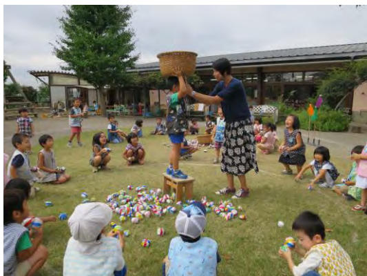
玉入れをする日もあります。