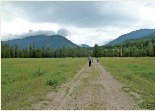
レモンクリーク収容所跡

リークを発った (WMS 1946-47)。今、レモンクリーク収容所跡は広大な草原となっている。