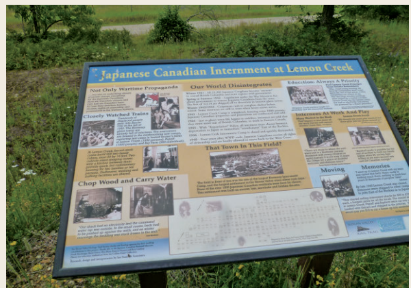
レモンクリークの日系収容記念プレート

こうした中、ハミルトンは自分たちの運営する学校を正式な私立学校として認可させるべくBC州教育省と交渉していた。1945年2月に再度教育省に、自分がコロンビア大学で修士号を取得（1923年）し、13年間も「東京の大きな女子校の校長」として勤務していたことなどの経歴を知らせ、認可してほしいことを依頼している（Letter 1945/2/24）。