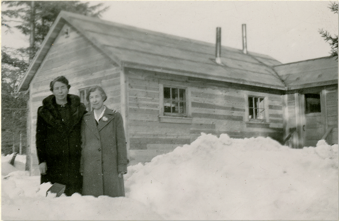
(画像：United Church Archives, Toronto. 93.049P/4078.より。1942年から1945年の間に撮影)