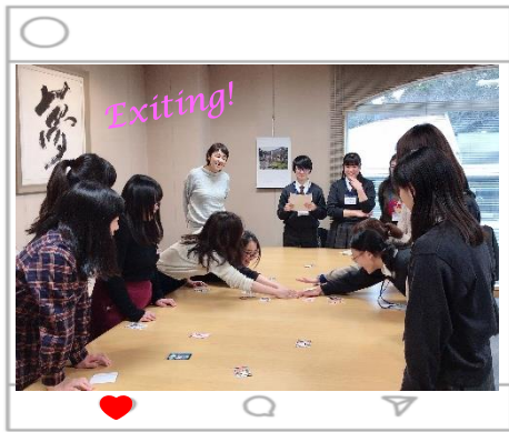
※ 写真は白熱した「作者カルタ」の様子です