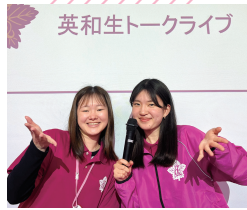
英和生トークライブ

「女子大って実際どう?」「大学生って忙しい?」などホンネが聞けるトークライブや、疑問や不安を相談できるブースなどで、入学後の自分の姿がイメージできます。