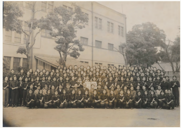
1945(昭和20)年3月、4年修了で卒業した学年の卒業記念写真