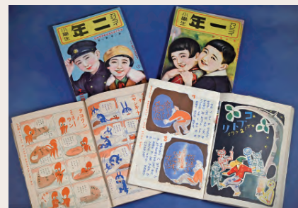
精文館が出版していた雑誌『カシコイ一年小学生』『カシコイ二年小学生』

詳しくはこちらをご覧ください。 https://www.nankichi.gr.jp/Tenzi/kikaku.html