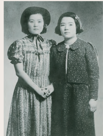
いわさきちひろ(左)、妹・世史子と(1939年)。映画「オーケストラの少女」のヒロインの衣装をまねて手づくりしたワンピースを着て

https://chihiro.jp/tokyo/exhibitions/89274/