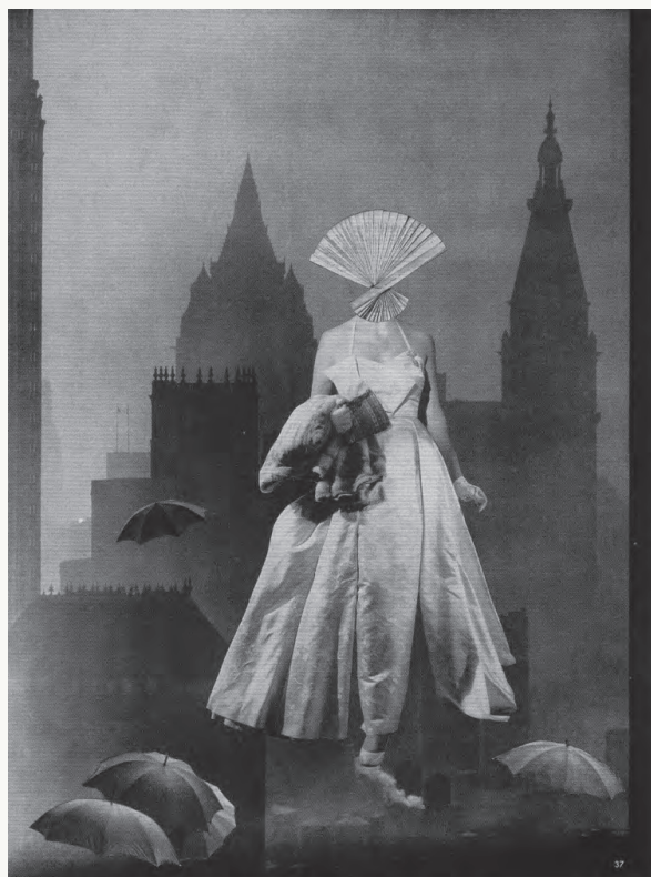
岡上淑子「夜間訪問」 © Okanoue Toshiko「夜間訪問」 Courtesy of The Third Gallery Aya

1953年、神田駿河台下にあったタケミヤ画廊で初の個展を開く。作品は評判を呼び、劇作家の寺山修司から共同作品の提案が寄せられるなど注目され