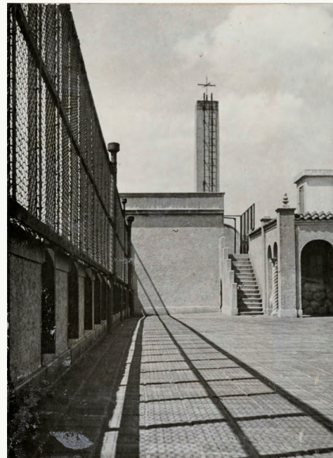
岡上さんが学んだ時代のウィリアム・メレル・ヴォーリズ設計の校舎屋上(昭和20年3月卒業生のアルバムより)