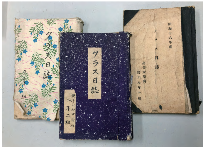
オリジナルのクラス日記の簿冊に、思い思いの千代紙などでカバーしているものも散見される。