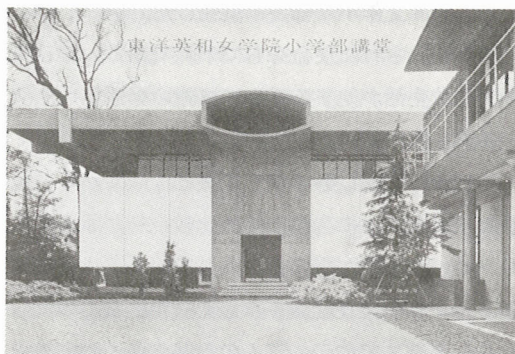
昭和35年新築の講堂

線後教育の反省として経験主義にきびしい批判をし、系統的学習の叫び、横の道德強調に走り縦の道德の欠除、畏敬の念を忘却した人間教育の姿、知的注入偏重教育を戒め、人格と人格の接触を打ち出せ（宗教教育の基底・建学精神、教会学校出席と五日制）、点数採点主義の反省などから基礎