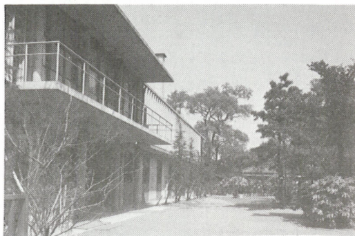
新校舎の玄関（右手に池があった）

母の会の運営活動も在来にも増して、より積極的自主的になり、委員の選出方法も毎年反省を加えてその方法・内規も進歩的なものになった。