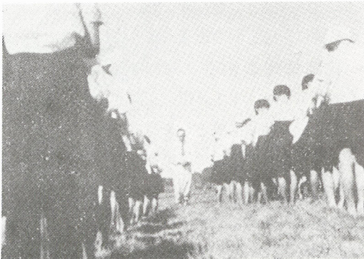
かがやきの芝生・朝の祈り

枯葉や枯枝枯草を集めての焚火での芋焼きは感激の最高潮である。手を灰だらけにして、口のまわりも黒くして、煙に涙を流しながら、うばいあつての焼芋の試食をする令嬢たちのあられもない