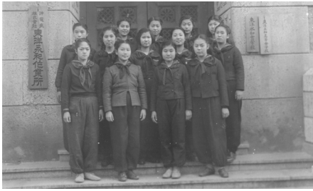
正面玄関 沖電気株式会社東洋永和作業所の表札がかかっている

たものを解体させるに忍びないと反対されたが、結局は工場側の強い要請に従わないわけにはいかなかった。