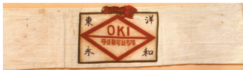
戦時下学徒勤労挺身隊の腕章 沖電気

煙草や勲章の箱作りも糊付けにコツがあり、防毒マスクの箱は筒型なので、作業はかなりむずかしかつたようだ。