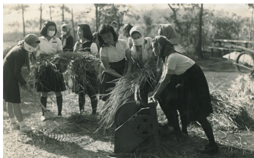
花小金井にあった学校農場での脱穀作業

今、自分が人の子の親となって、戦争中の学校生活を振り返ってみると、先生方は、大勢の生徒を、何時如何なる事態になるかわからない状況の下で預かり、指導教育するという、この時代ならではの大変な御苦勞をしていて下さった