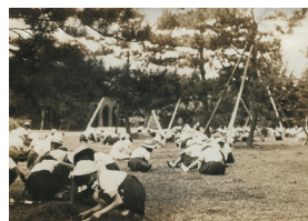
除草の勤労働奉仕