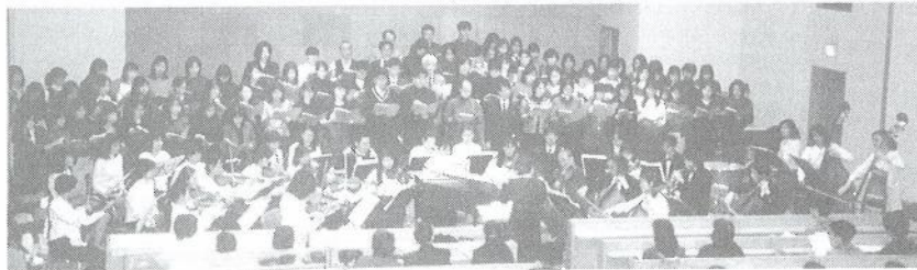
短期大学メサイア