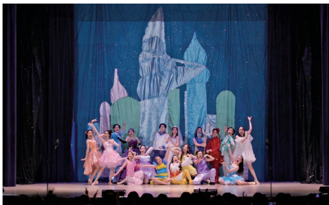
2024年10月 第56回楓祭で上演された“The Little Mermaid” (新マーガレット・クレイグ記念講堂にて)