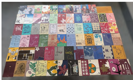
(上) 1957～2024年の「楓」 (下) 1968年度から2024年度の楓祭パンフレット

このプレゼンテーションは、OG会の大規模開催が確実にようになってきた頃から準備を始めたものです。筆者たちは史料室に通い、68年分（1957年～2024年）の生徒会発行「楓」、そして57年分（1968年度～2024年度）の楓祭パンフレットを1冊ずつ調べました。「楓」に掲載されているクラブ活動報告からEDCのページを見つけ出し、写真を撮り、それをWordにおこして体裁を整える…という作業を68年分繰り返しながら、楓祭パンフレットに掲載された情報と齟齬がないかも確認しました。