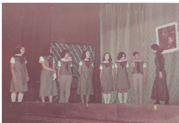
1970年4月 第2回楓祭で上演された“THE TRAPS FAMILY” (旧マーガレット・クレイグ記念講堂にて)