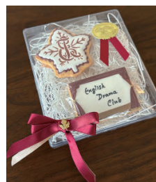
お土産のクッキー。下は大講堂の舞台をイメージしたデザイン

今から100年以上も前に行われていたEnglish Dramaの歴史。私たちはそれを1年1年積み重ね、たしかに受け継いできました。このように長い歴史があり、自分たちもその一部だった、ということに、深い感慨を覚えます。OG会の開催に合わせてEDCの歴史を知る機会を得たこと、それをご出席の皆さまと共有させていただけたことに、心から感謝申し上げます。