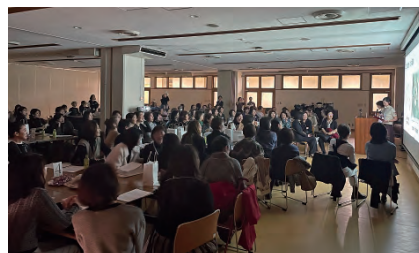
筆者たちによるプレゼンテーション

さて、前述のとおり、OG会では前半に「EDCの歴史」についてのプレゼンテーションを行い、約60年にわたる楓祭と、楓祭が始まる前のEnglish Dramaについてお話ししました。