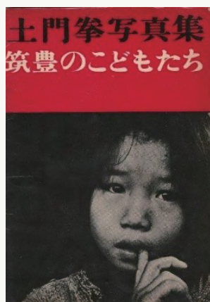
土門拳が「この写真集だけは美しいグラビア用紙ではなくザラ紙で作りたいかった」と語った筑豊炭鉱の写真集表紙

そうした状況下にあっても、東洋英和短大の学生は、東京神学大学の学生とともに最も息の長い活動を続け1970年までキャラバンを行った。東洋英和短大が活動を継続し続けられた理由として、参加学生が保育を学ぶ保育学生であったことがあげられる。東洋英和には他校にはない保育科があり、保育という専門的な知見から子どもや家族の困難に気づくことができた。保育を学ぶ学生たちには、当事者が望む生への敬意をもち、当地での暮らしを支える手立てを見通すことができた。東洋英和の保育学生には、そこで自分に与えられている使命（ミッション）を見出し、当然のこととしてそれを担い貢献する姿勢が身についていたのだろう。東洋英和の学院標語である「敬神奉仕」は、こうして保育者としてのふる