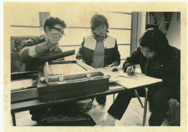
ガリ版でお便りを刷る保育者

入園式も済み、いよいよ子どもたちも一人だけをする時がやってきました。入園してからの注意等をお読みになり、一日も早く子どもさん方が園になれ、楽しい保育園生活が送れますよう。又遊具も少なく園もまだまだこれからというところす