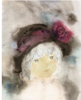
いわさきちひろ バラ飾りの帽子の少女 1971年 ちひろ美術館蔵

いわさきちひろ(1918-1974)、茨木のり子(1926-2006)、岡上淑子(1928-)は、第二次世界大戦後、それぞれ、絵本画家、詩人、美術作家となり、美しいものへ誠実にまなざしを向けました。本展では、2025年9月刊行の行司千絵・著『装いの翼 おしゃれと表現と——いわさきちひろ、茨木のり子、岡上淑子』(岩波書店)を起点として、「装い」をテーマに3人の女性作家の素顔に迫ります。それぞれの作品とことば、愛用の品や写真などを展示し、三者三様の美意識や生き方と、自由と平和を求める共通の思いを浮き彫りにします。