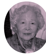
岡上淑子 Toshiko Okanoue

1926(大正15)年、大阪で生まれ、6歳のときに医師である父の転勤により愛知県西尾町(現・西尾市)へ移住。帝国女子医学薬学専門学校(現・東邦大学薬学部)卒業。24歳で詩作活動を開始し、川崎洋と同人「権」を結成。谷川俊太郎・岸田衿子・大岡信らとともに詩壇を牽引する。詩集に『対話』(不知火社)、『見えない配達夫』(飯塚書店)、『自分の感受性くらい』(花神社)、『倚りかからず』(筑摩書房)など。