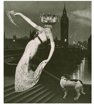
岡上淑子 彷徨 1956年 個人蔵 ©OKANOUE Toshiko Courtesy of The Third Gallery Aya