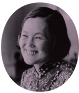
いわさきちひろ Chihiro Iwasaki

1918(大正7)年、福井県武生(現・越前市)生まれ、東京で育つ。東京府立第六高等女学校卒。藤原行成流の書を学び、絵は岡田三郎助、中谷泰、丸木俊に師事。1950年松本善明と結婚。翌年長男猛誕生。子どもを生涯のテーマとして描く。絵本に『おふろでちゃぶちゃぶ』(童心社)、『あめのひのおるすばん』、『こたりのくるひ』(至光社)、『戦火のなかの子どもたち』(岩崎書店)など。