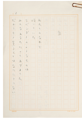
茨木のり子 「泉」自筆原稿 個人蔵 撮影:小畑雄剛 『茨木のり子の家』(平凡社 2010年)より